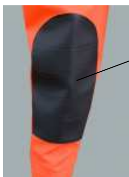
Renfort des genoux