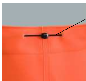
Cordon de serrage