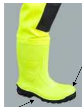
Bottes de sécurité